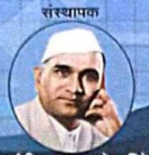
कर्मवीर भाऊसाहेब हिरे